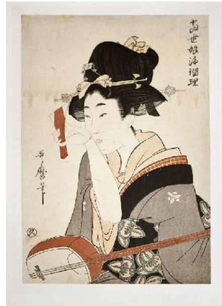
Utamaro : joueuse de Shamisen