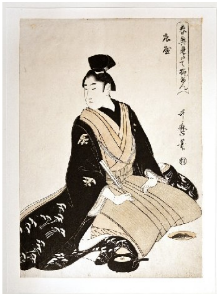
Utamaro : jeune noble en robe noire