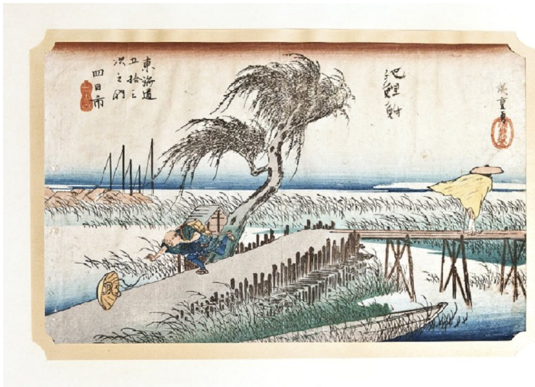
Hiroshige : 44e station Yoka-itchi - le coup de vent