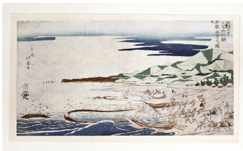
Hokusai : la pêche au filet

Un catalogue de 60 pages regroupera, en quadrichromie et en noir et blanc, des reproductions de la plupart des pièces qui figurent dans cette exposition. Au sommaire, des textes de Muriel Calvet, Roger Little, Alain Paire et Alain Vidal-Naquet.