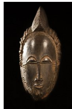
Masque Baoulé, Côte d'Ivoire