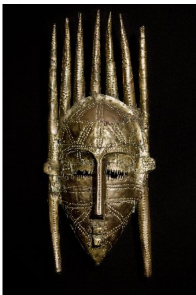
Masque Bamana, Mali