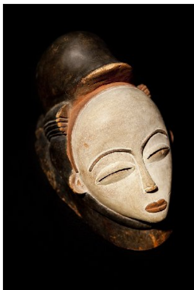
Masque Muyuki, Gabon