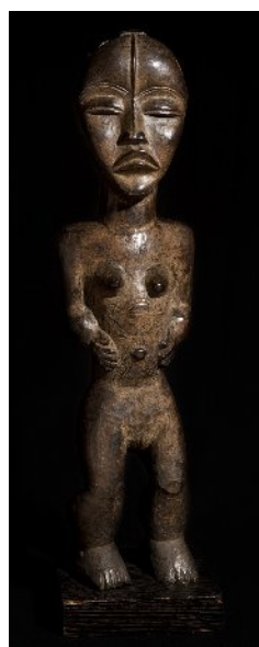
Statue Dan, Côte d'Ivoire